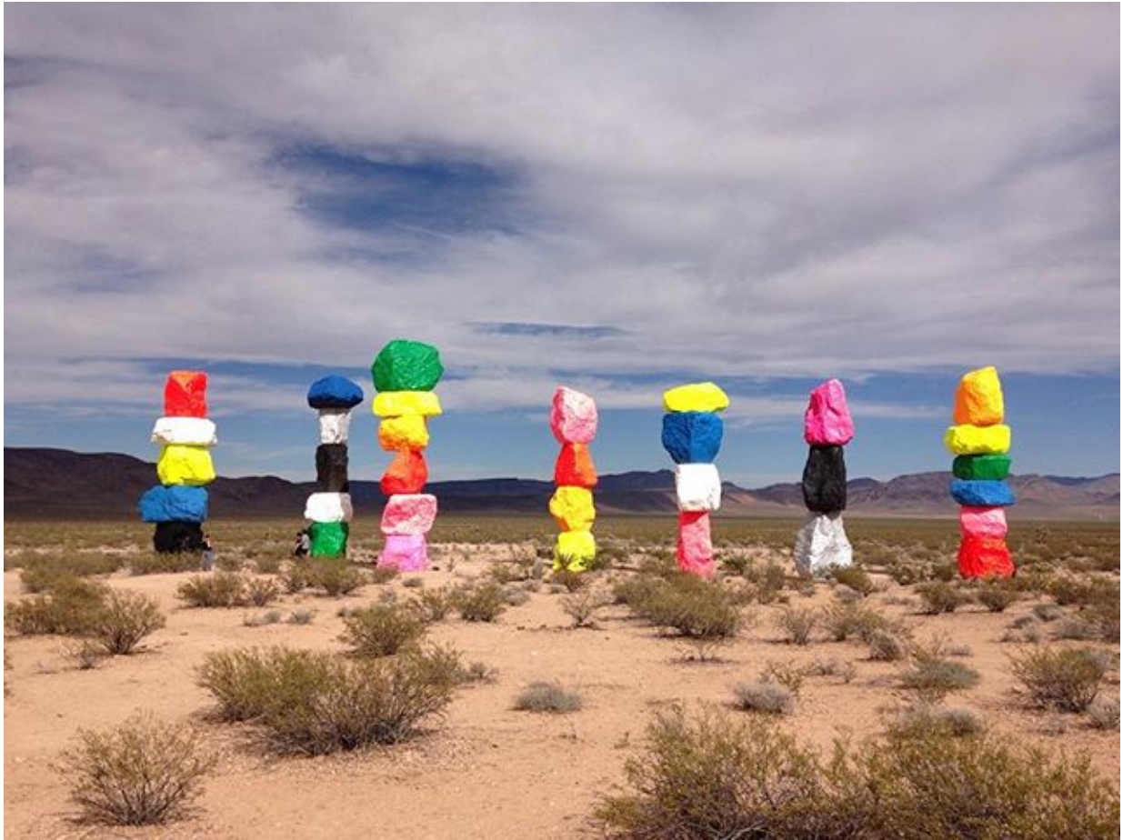
Ugo Rondinone, Seven Magic Mountains , 2016, large-scale site-specific public art installation located near Jean Dry Lake