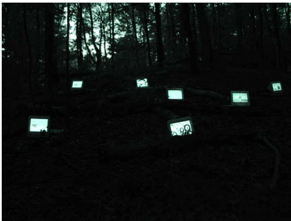
Josephine Bosma, "Technorganic-Peppermint".

Con un solo verso un poeta può mostrare il doppio nodo che lo lega al proprio tempo e al tempo che non c'è, all'accadere e all'impossibile. In un verso, in un solo verso, un poeta può rivelare il suo sguardo, in grado di rivolgersi all'enigma che è il proprio cielo interiore e al movimento delle costellazioni, alla lingua del sentire e del patire di cui diceva Leopardi e all'alfabeto degli astri di cui diceva Mallarmé. Un verso, un solo verso, può essere il cristallo in cui si specchiano gli altri versi che compongono un testo. Per questo da un verso, da un solo verso, possiamo muovere all'ascolto dell'intera poesia.