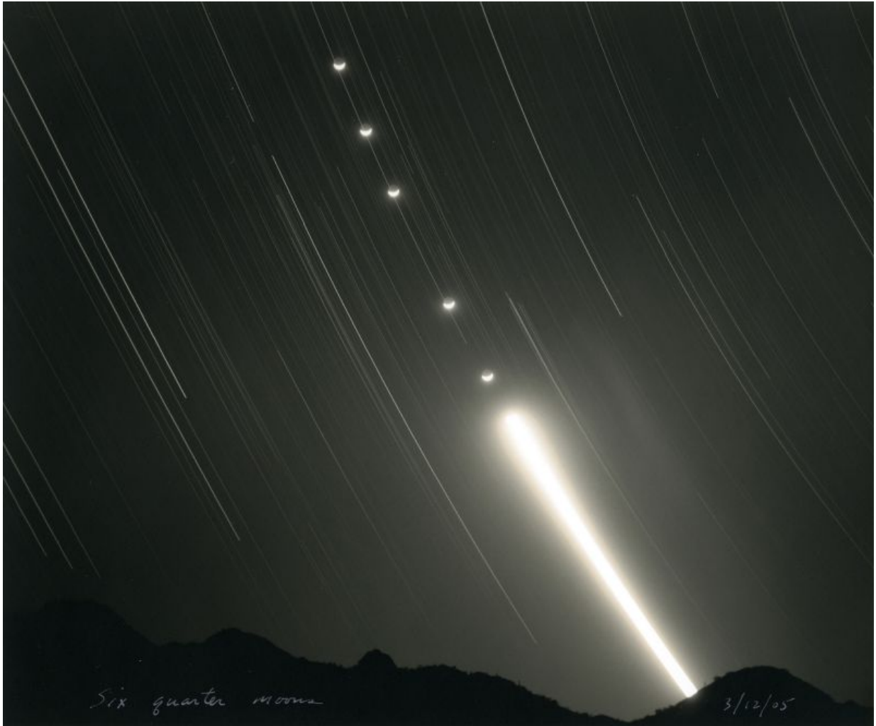
Mark Klett, Six Quarter Moons , 2005, toned gelatin silver print.